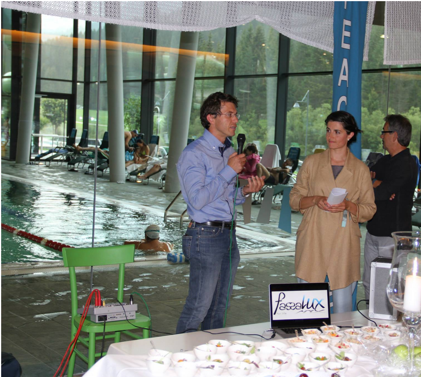
"Abbasso la guerra. Persone e movimenti per la pace dall'800 ad oggi". Questo il titolo della mostra fotografica curata da Francesco Pugliese inaugurata giovedì 20 agosto al centro acquatico Dòlaondes a Canazei da FassaLux.